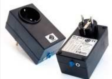
BJ-Funksteckdose für einen Verbraucher mit Netzspannung