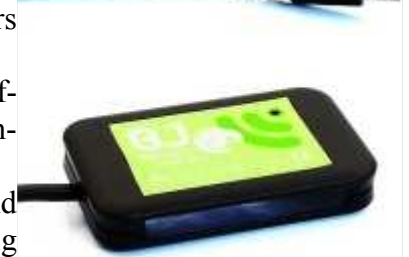
Sendeteil für BJ Control USB