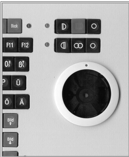
M52ro-B (Tasten über der Rollkugel)