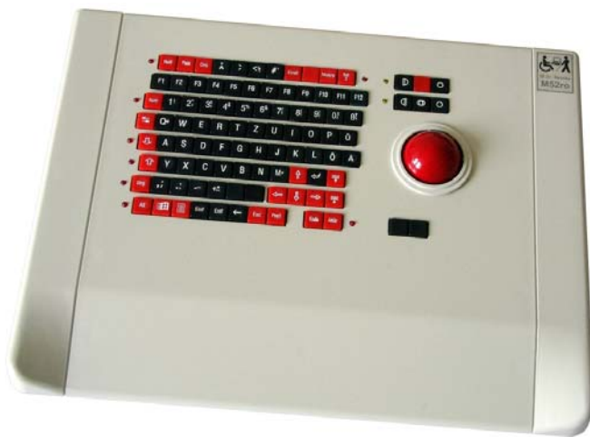
Best.-Nr.: ts-m52ro-usb hier Form D der Maustasten

Diese Tastatur ist mit leichtgängigen, eng aneinanderliegenden Kleintasten bestückt und kann eine Standardtastatur vollständig ersetzen. Sie bietet daher den PC-Nutzern einen Ausgleich, deren Kraft und Aktionsbereich stark beeinträchtigt sind. Das Pultgehäuse dient gleichzeitig zur Abstützung der Hand und zum einfachen Wechsel zwischen Tastatur und Maus. Die Möglichkeit, Makros auf allen Buchstabentasten zu definieren, erleichtert die Arbeit zusätzlich.