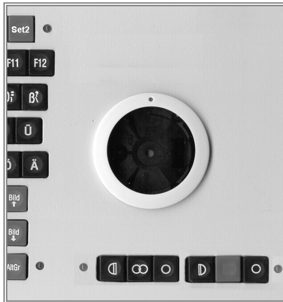
M52ro-C (Tasten unter der Rollkugel)