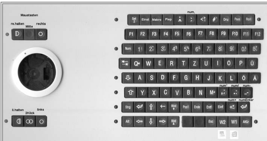
M52ro-D im Bild auf der Vorderseite (Maustasten oberhalb der Kugel, nur zwei linke Maustasten unterhalb)