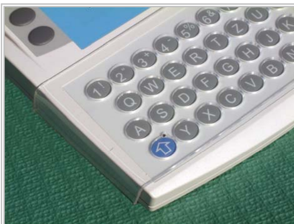
Fingerführungsgitter Plexiglas Best.-Nr.: ko-spok-z-f