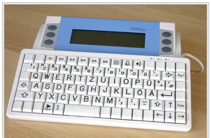
Sonderausführung mit großen Tasten (Cherry) Best.-Nr.: ko-spok-cherry